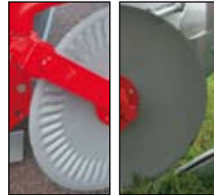
Kiekkol. on saatavina joustavina tai kiinteinä.