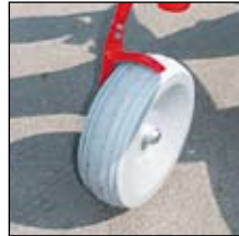
Teräksinen tukipyörä (500x160mm).