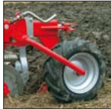
Kuminen tukipyörä (574x213mm)