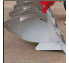
Veitsileikkuri, kuorin ja maapuoli-leikkuri.