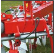
Hydraulinen veto-kartun säädin.