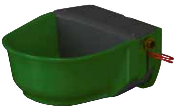
LÄMMITETTÄVÄ MUOVINEN UIMURIKUPPI

SISÄÄNRAKENNETTU MUUNTAJA. KYTKENTÄ SUORAAN PISTORASIAAN!