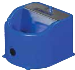
LÄMMITETTÄVÄ JUOMA-ALLAS PT11

Pitää juomaveden sulana jopa -30 °C asteessa. Sisältää muuntajan, sekä 2 m heikkovirtajohdon muuntajalta astialle.