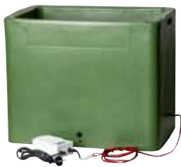
LÄMMITETTÄVÄ JUOMA- ASTIA THERMOBAR 65 L

Eristetty juoma-astia, jossa lämmityselementti pohjassa. Pysyy sulana n. -20 °C asteeseen asti. Sisäänrakennettu muuntaja. Kytkentä suoraan pistorasiaan.