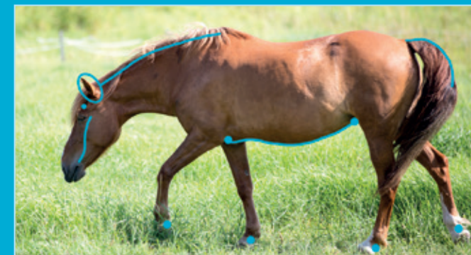
Kesäihottumahevosen oireilevat alueet.